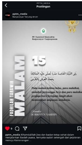
Gambar 2 @pptm_media

Pada gambar 2 konten ini berasal dari akun Instagram @pptm_media yang mengunggah visual berjudul “Fadhilah Tarawih Malam ke-15”. Postingan ini mendapat 9 respon like, Dalam poster tersebut disebutkan bahwa malam ke-15, para malaikat, termasuk malaikat penyangga Arsy dan penjaga kursi kerajaan langit, memohonkan ampun untuk orang yang melakukan tarawih. Teks ini dikutip dari kitab Durratun Nasihin, yang secara tradisional dikenal sebagai karya motivasional keagamaan namun tidak secara konsisten merujuk pada hadis-hadis sahih. Penggunaan kalimat “para malaikat memohonkan ampun” menciptakan efek emosional yang kuat bagi pembaca dan memberikan dorongan spiritual yang besar untuk melaksanakan tarawih. Secara desain, poster ini cukup elegan, dengan tipografi yang jelas dan nuansa islami. Namun, secara akademik, penting untuk dicatat bahwa Durratun Nasihin bukan sumber utama dalam disiplin hadis. Hadis-hadis yang dikutip dari kitab ini memerlukan klarifikasi dan klasifikasi ulang sebelum dapat dijadikan rujukan keagamaan dalam bentuk publikasi digital masal.