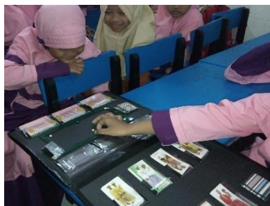
Gambar 3. Penggunaan Media Zook secara berkelompok

4,60 (sangat baik), percaya diri bernilai 4,67 (sangat baik), dan fokus kegiatan bernilai 4,33 (sangat baik). Dari tabel hasil observasi dapat disimpulkan bahwa aspek dalam pembelajaran memiliki predikat sangat baik.