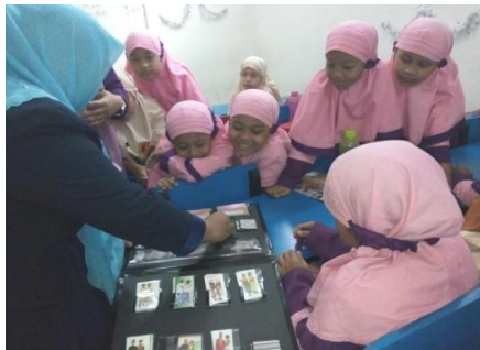
Gambar 4. Simulasi Penggunaan Media Zook

Media Zook dikembangkan dengan spesifikasi berikut: (1) Buku dengan package lengkap: materi & game; (2) Bertujuan mengurangi penggunaan gadget; (3) Permainan yang edukatif; (4) Penyampaian materi tidak membosankan; (5) Buku berbentuk big book dan Zig-zag; (6) Isi materi dapat disesuaikan dengan mata pelajaran lainnya; (7) Buah pengembangan kreativitas guru; (8) Melatih kerjasama antar siswa dalam kelompok; (9) Terbuat dari bahan yang mudah dicari.