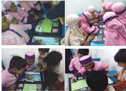
Gambar 5. Aktivitas Menggunakan Media Zook dalam Kelompok

kegiatan proses pembelajaran melalui kerja kelompok tetapi juga meningkatkan kegiatan sosial antar satu sama lain.